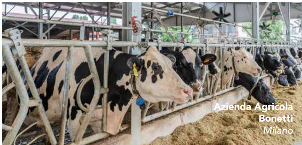
Azienda Agricola Bonetti Milano