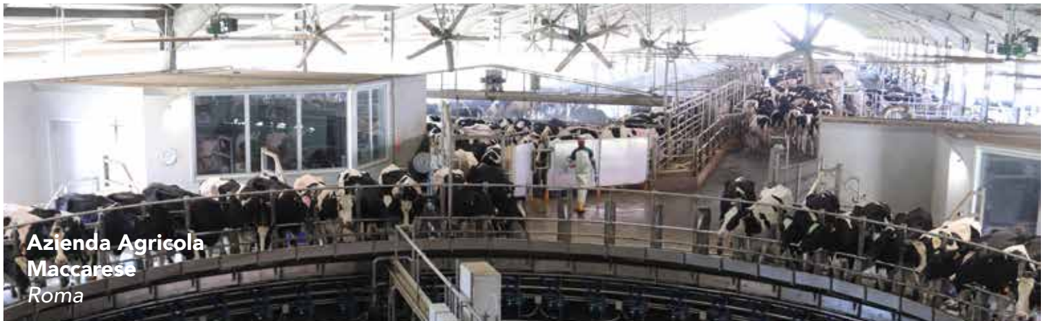
Azienda Agricola Maccarese Roma