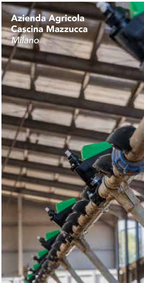
Azienda Agricola Cascina Mazzucca Milano